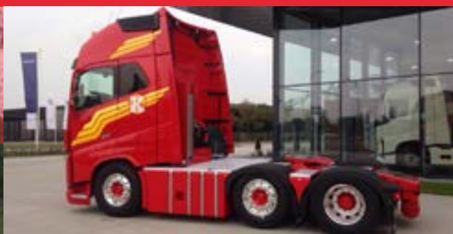
Verschillende voorbeelden van brandstoftanks op een FH 6x2/4.