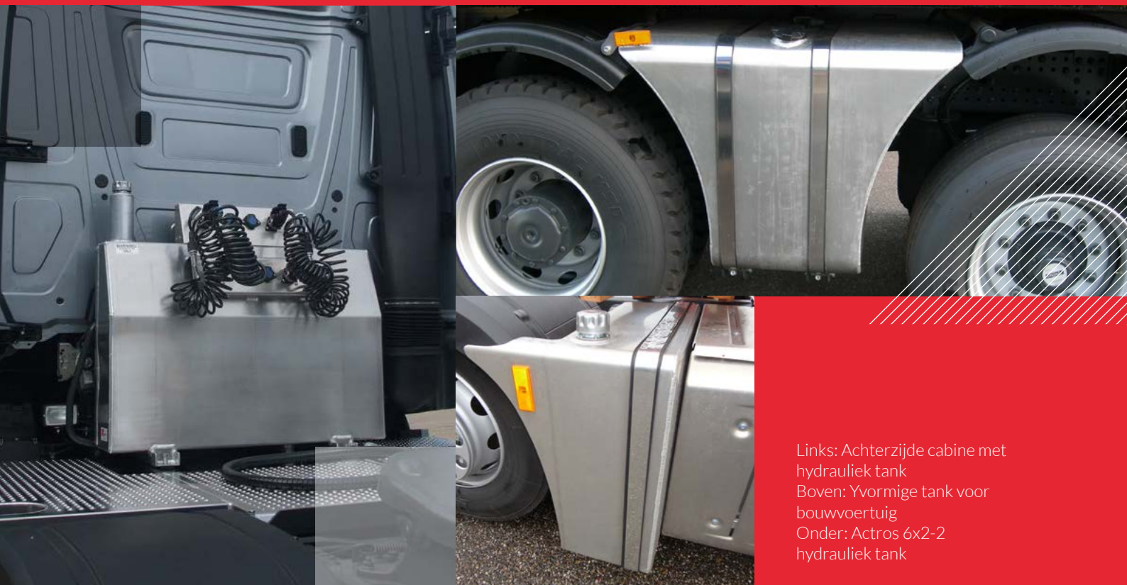
Links: Achterzijde cabine met hydrauliek tank Boven: Yvormige tank voor bouwvoertuig Onder: Actros 6x2-2 hydrauliek tank