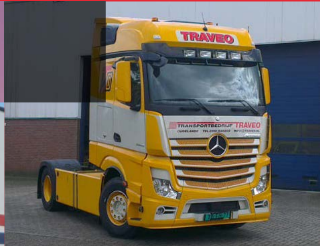
MB Actros 6x2 met brandstoftank en (scharnierende) optische verlenging